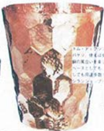
洗練の輝きは洗練のスタイル。銅材の質感と洗練のスタイルが、洗練のスタイルを演出する。カラーの輝きは洗練のスタイルを演出する。カラーの輝きは洗練のスタイルを演出する。