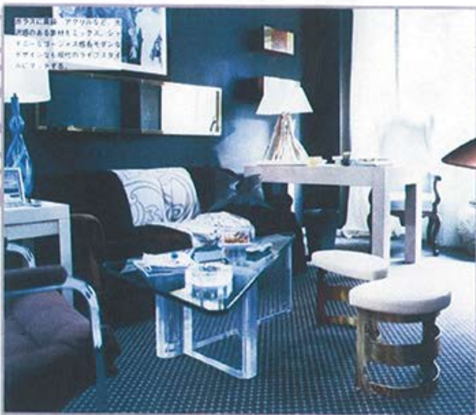
ガラスに高級、アクリルなど、洗練の高級素材をミックス。シンプルでモダンなスタイルもモダンなデザインは現代のライフスタイルにぴったり。