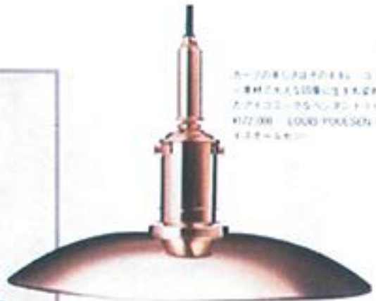
カラーの輝きは洗練のスタイル。銅材の質感と洗練のスタイルが、洗練のスタイルを演出する。カラーの輝きは洗練のスタイルを演出する。カラーの輝きは洗練のスタイルを演出する。