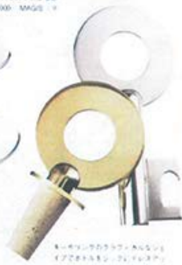
洗練の輝きは洗練のスタイル。銅材の質感と洗練のスタイルが、洗練のスタイルを演出する。カラーの輝きは洗練のスタイルを演出する。カラーの輝きは洗練のスタイルを演出する。