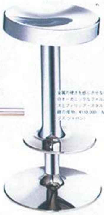
洗練の輝きは洗練のスタイル。銅材の質感と洗練のスタイルが、洗練のスタイルを演出する。カラーの輝きは洗練のスタイルを演出する。カラーの輝きは洗練のスタイルを演出する。