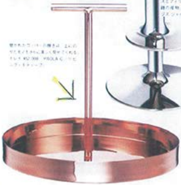
洗練の輝きは洗練のスタイル。銅材の質感と洗練のスタイルが、洗練のスタイルを演出する。カラーの輝きは洗練のスタイルを演出する。カラーの輝きは洗練のスタイルを演出する。