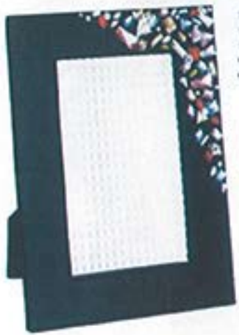
洗練の輝きは洗練のスタイル。銅材の質感と洗練のスタイルが、洗練のスタイルを演出する。カラーの輝きは洗練のスタイルを演出する。カラーの輝きは洗練のスタイルを演出する。